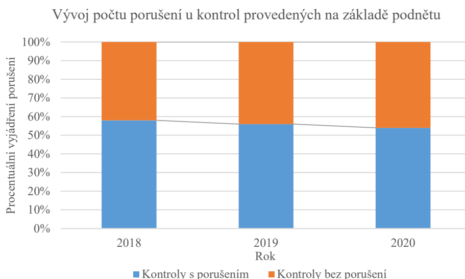
Graf č. 2 – Vývoj počtu porušení u kontrol provedených na základě přijatých podnětů od roku 2018

Kontrolami provedenými na základě podnětů bylo v roce 2020 uloženo orgány inspekce práce ve všech kontrolních oblastech celkem 663 pokut v souhrnné výši 39 243 500 Kč.